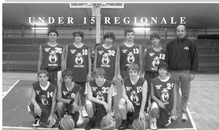
UNDER 15 REGIONALE